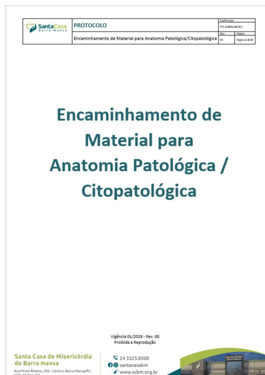
Figura 1 – Protocolo de encaminhamento de material para anatomia patológica/citopatológica.